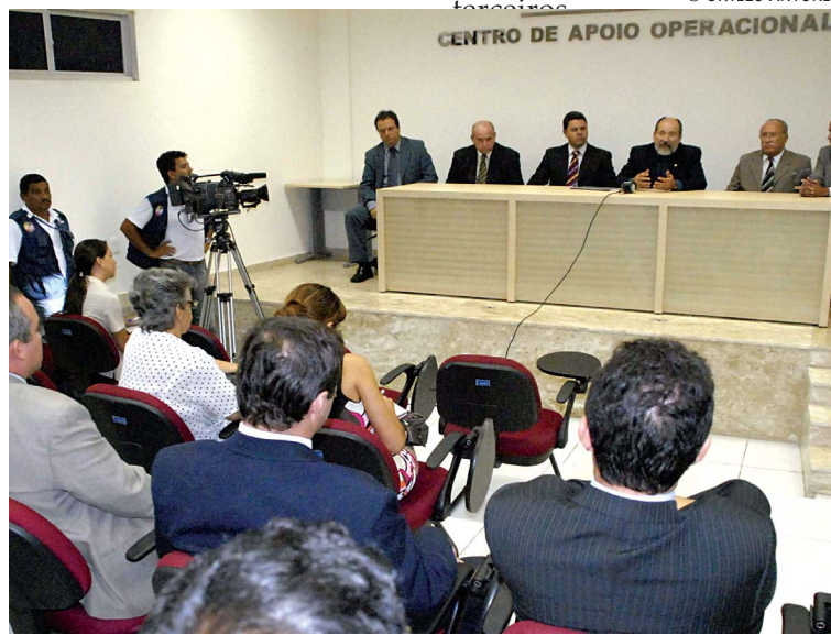
Na reunião foi exigida a instalação de câmeras próximo aos bancos