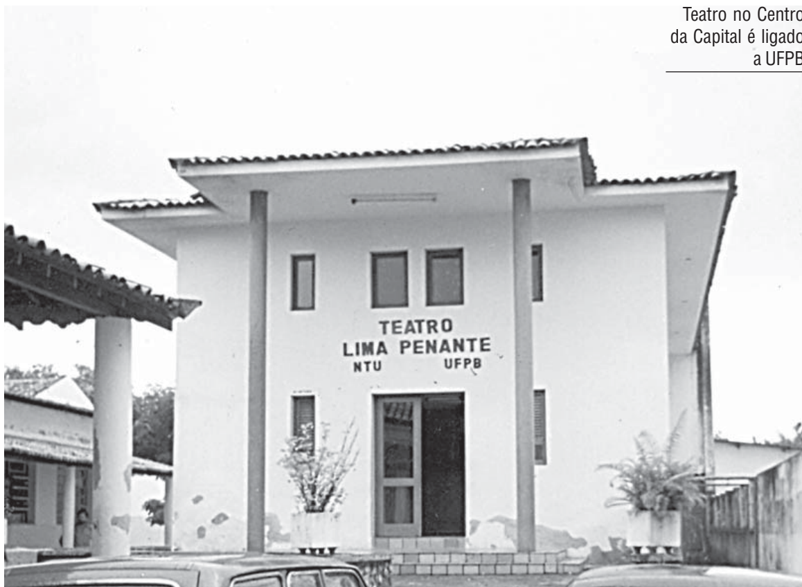
Teatro no Centro da Capital é ligado a UFPB

E é com estas mãos que há pouco saíram da terra abençoada que eu, com as energias restauradas e em paz com meu coração e minha mente, escrevo este texto.