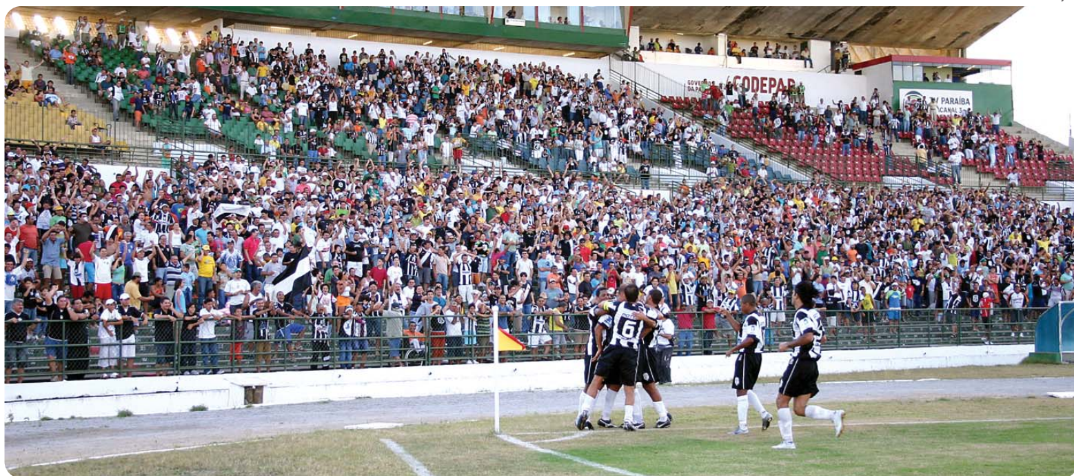
Dirigentes do Treze esperam contar com a força máxima nas arquibancadas e cadeiras do estádio Amigão para superar o Sousa no próximo domingo