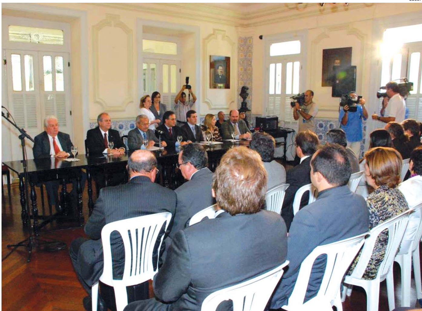
Aos auxiliares o governador anunciou medidas administrativas e afirmou que austeridade e transparência serão marcas de sua administração