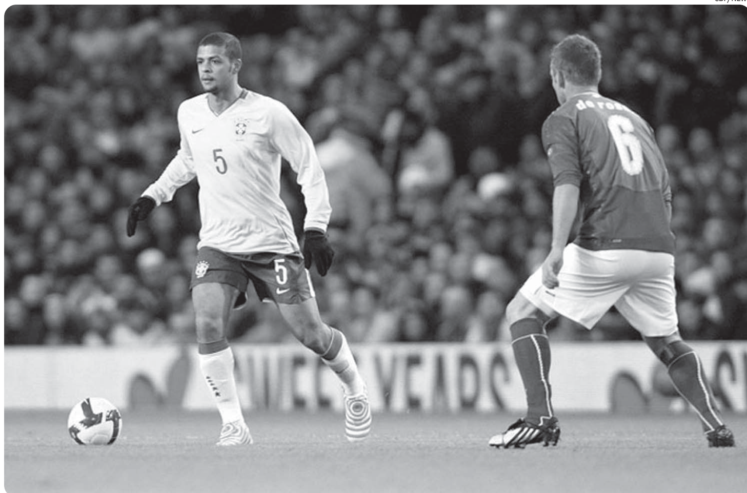
O meia Felipe Melo foi uma grata surpresa na vitória do Brasil sobre a Itália por 2 a 0, em amistoso disputado em Londres, no mês passado

"A gente confia que ele continuará mantendo o mesmo nível, vai depender dele. Mas em todas as posições nós temos quatro opções. Muitos querem que o Brasil jogue com 10 atacantes. É preciso ser eficiente, como fez a Itália (na Alemanha, em 2006). Nós só ganhamos a Copa quando fomos humildes tecnicamente ao correr atrás e usar a nossa qualidade. Quando conseguimos empatar a disposição dos europeus, a qualidade faz diferença. Você tem que ser eficiente", discursou.