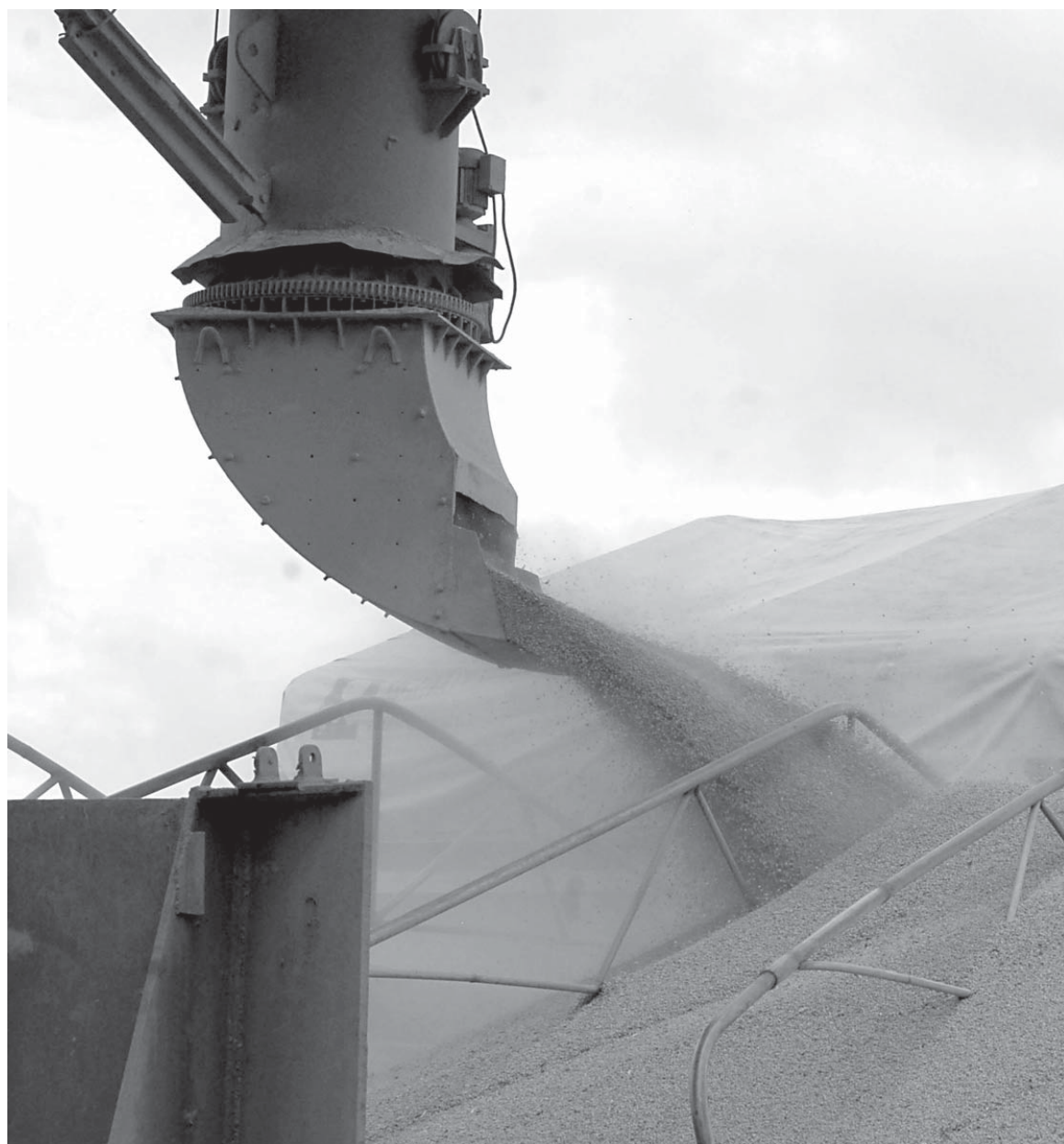
A produção de soja em fevereiro cresceu de 57,21 para 57,63 milhões de toneladas, aumento de 0,7 por cento.

A pesquisa divulgada hoje foi realizada entre os dias 16 e 20 de fevereiro. Foram ouvidos produtores rurais, agrônomos e técnicos de cooperativas, secretarias de agricultura, órgãos de assistência técnica e extensão rural e agentes financeiros dos principais municípios produtores do país. Confirmados esses números, a safra 2008/2009 será a segunda maior da história, perdendo apenas para a anterior.