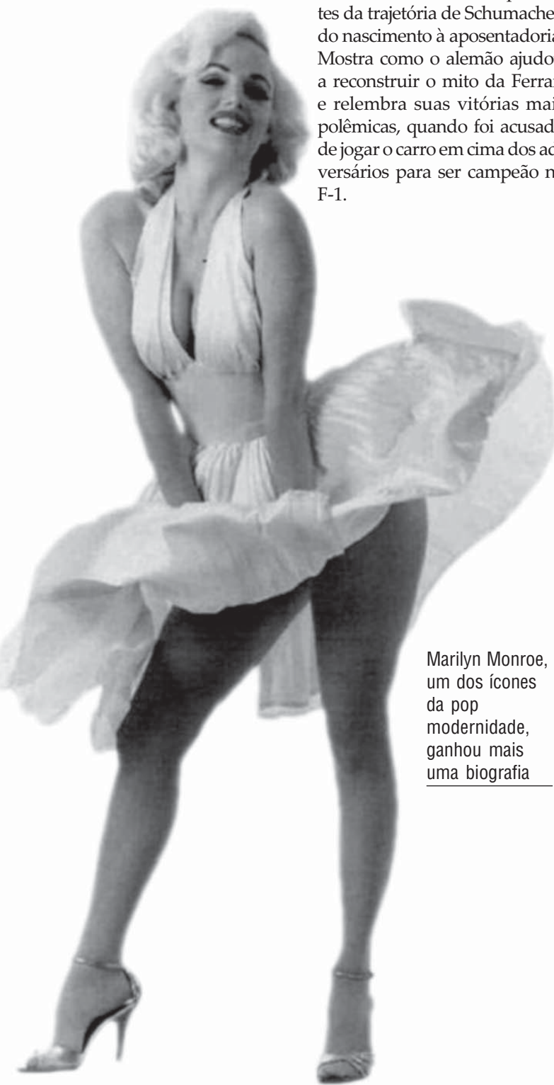
Marilyn Monroe, um dos ícones da pop modernidade, ganhou mais uma biografia

A máquina - Michael Schumacher, o melhor de todos os tempos" - (Best Seller, 2008) conta a história do maior vencedor da história da F-1. De origem humilde e jeito introspectivo, o alemão Michael Schumacher tornou-se um fenômeno sem paralelos no automobilismo, conquistando sete títulos mundiais da F-1 e batendo todos os records relevantes da categoria, chegando onde nenhum outro piloto jamais chegou. O livro faz uma retrospectiva detalhada dos momentos mais importantes da trajetória de Schumacher, do nascimento à aposentadoria. Mostra como o alemão ajudou a reconstruir o mito da Ferrari e relembra suas vitórias mais polêmicas, quando foi acusado de jogar o carro em cima dos adversários para ser campeão na F-1.