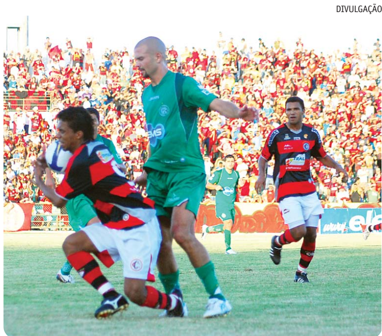
Campinense volta a enfrentar o Guarani, agora pelo Brasileiro da Série B