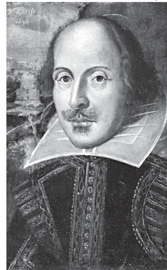
Dramaturgo inglês William Shakespeare

pany, empresa proprietária do local, planeja abrir um novo teatro no mesmo lugar até 2012.